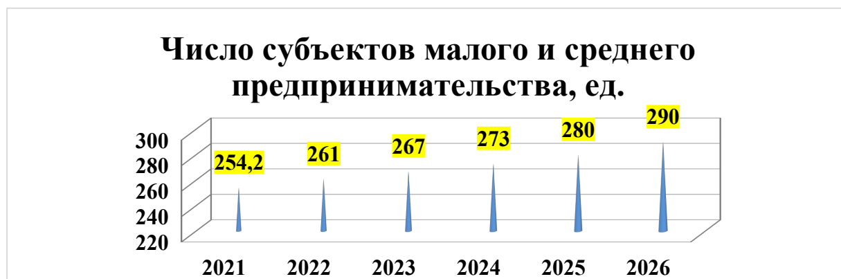
Рис.1 Число субъектов малого и среднего предпринимательства на расчете на 10 тысяч человек

По данным Управления Федеральной налоговой службы по Республике Алтай в МО «Чойский район» по состоянию на 10.01.2023 г. зарегистрировано 313 налогоплательщиков, применяющих специальный налоговый режим «Налог на профессиональный доход», в том числе 15 индивидуальных предпринимателей, 298 физических лиц.